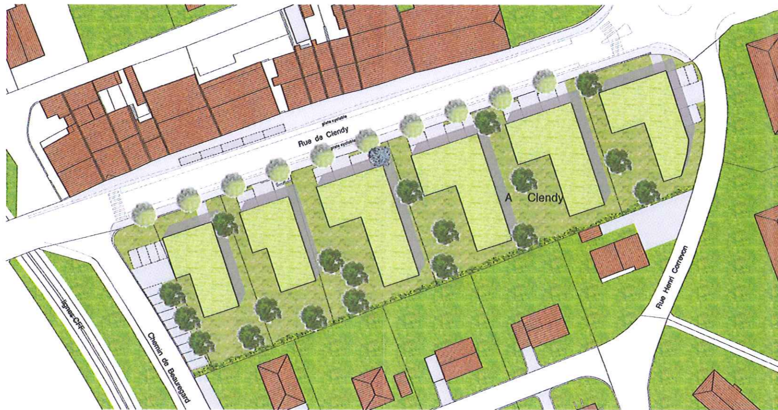
PRINCIPE DE REALISATION