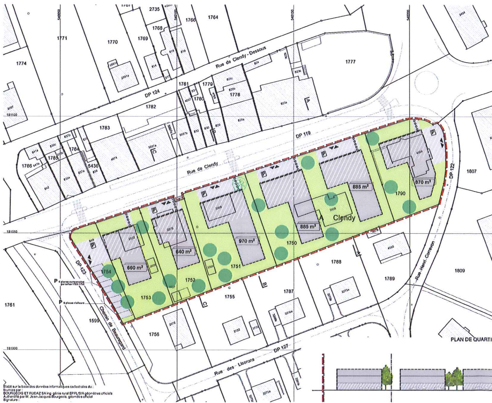
PLAN DE QUARTIER