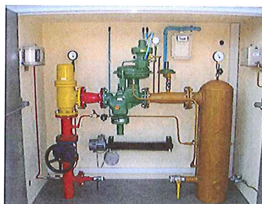
Station de détente après rénovation