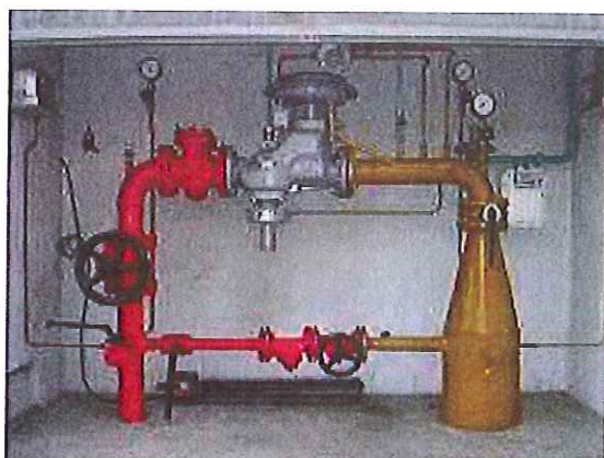
Station de détente avant rénovation

et à installer une nouvelle station de détente sur l'alimentation en gaz du compresseur GNC (gaz naturel carburant).